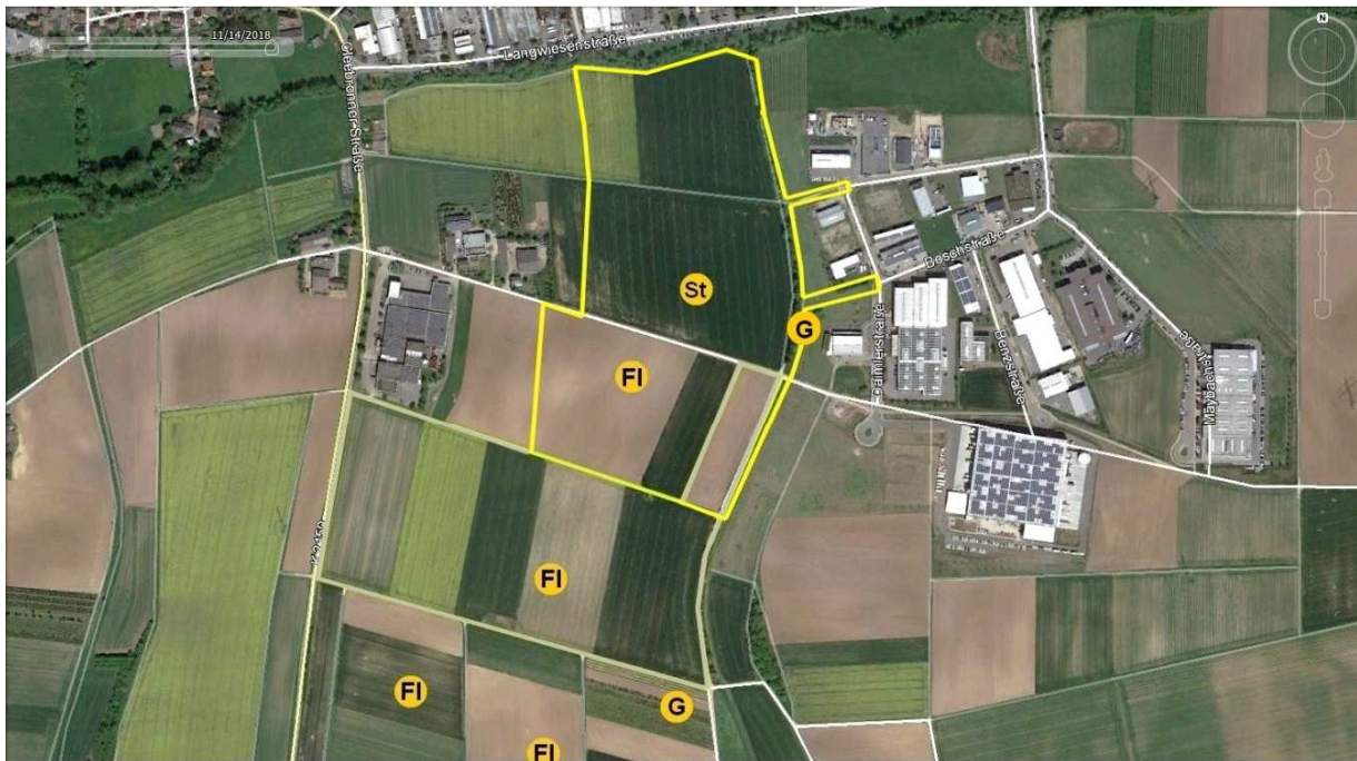
Abbildung 3 Revierzentren artenschutzrechtlich hervorgehobener Brutvogelarten im Plangebiet (gelb umrandet) und Kontaktlebensraum. FI - Feldlerche, G - Goldammer, St - Wiesenschafstelze.