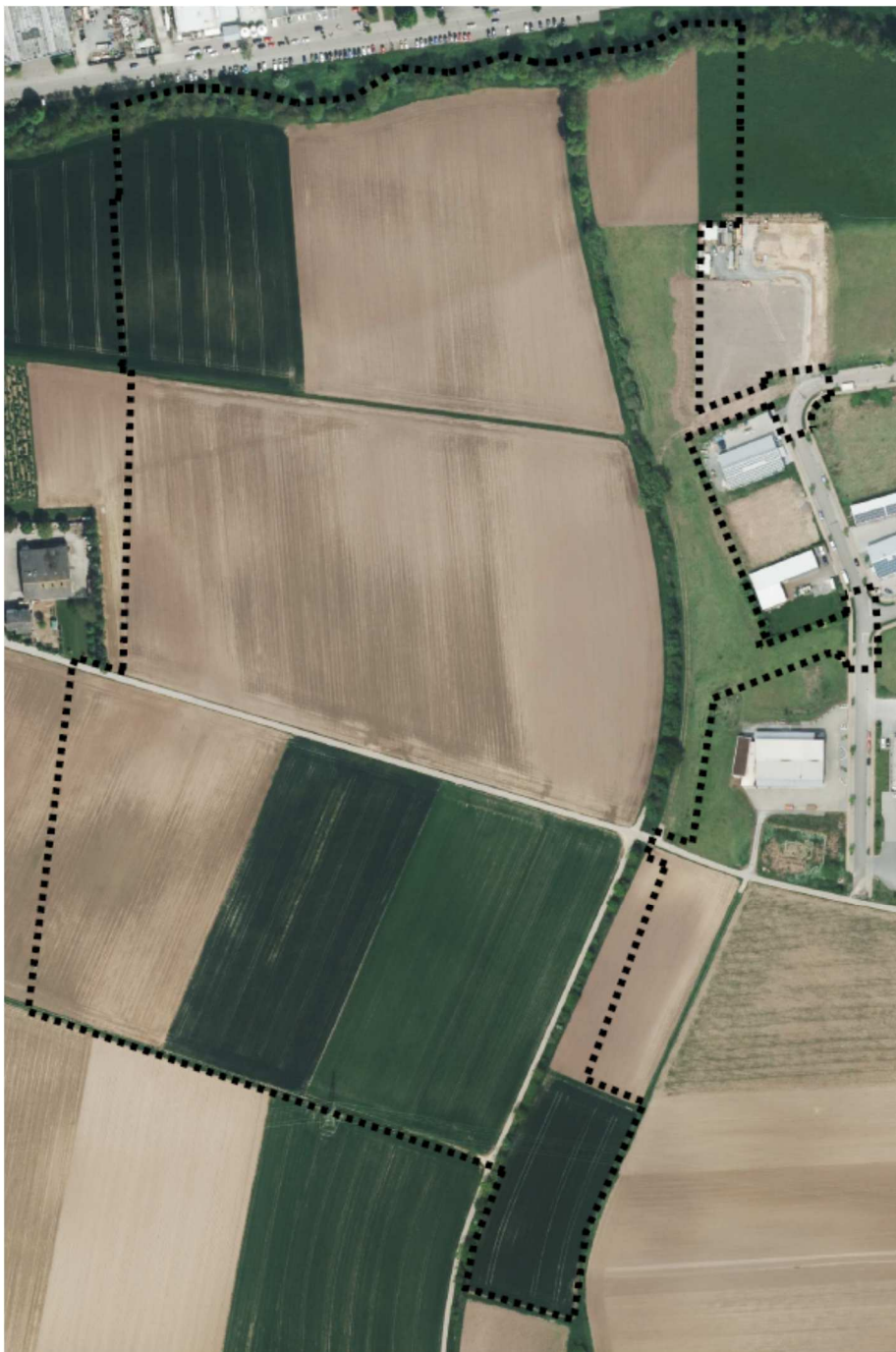
Abbildung 2 Geltungsbereich des Plangebiets

Das Plangebiet befindet sich im Gewann „Rahnsbacher Straße“, südlich von Güglingen-Frauenzimmern und östlich der K 2150. Die Zufahrt ist über eine Fläche im Nordosten des Plangebiets vorgesehen. Die Planfläche wird überwiegend ackerbaulich genutzt, Gehölze sind nicht vorhanden. Ein Gehölzbestand entlang eines asphaltierten Feldwegs schließt die Planfläche nach Osten ab. Im Westen grenzen Gewerbegebäude und ein landwirtschaftlicher Betrieb an das Plangebiet an. Die umgebenden Kontaktlebensräume sind ausgedehnte Ackerflächen.