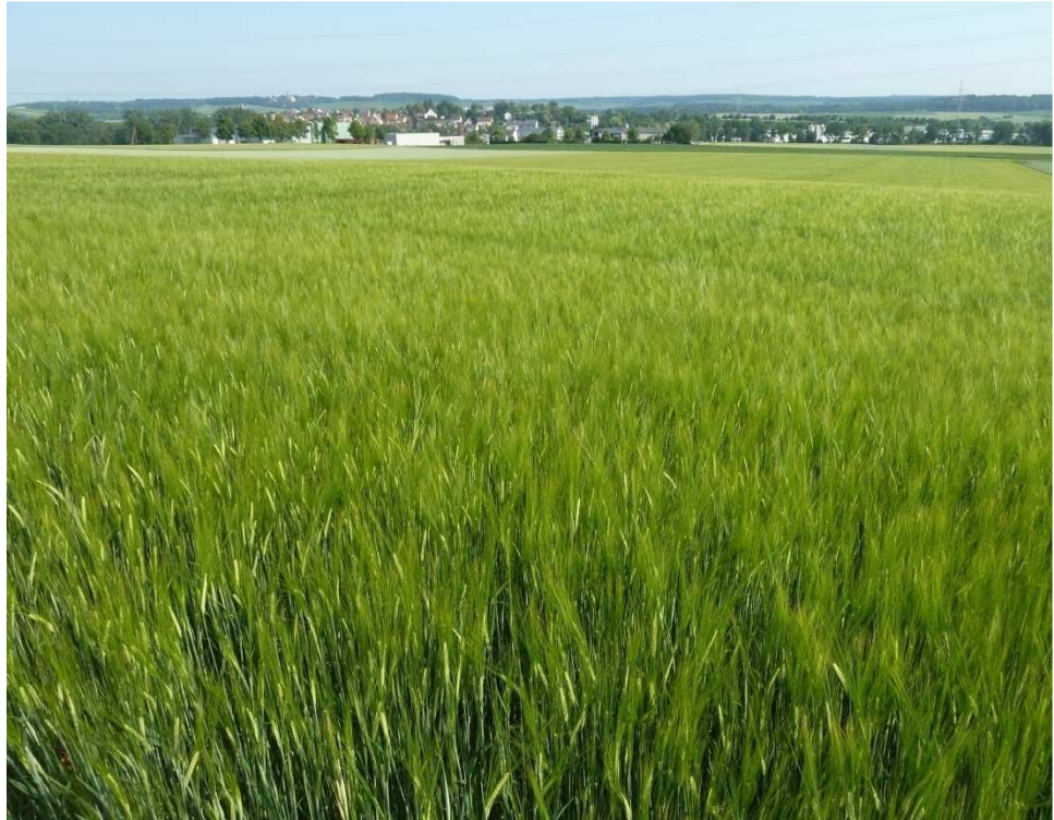
Teilaspekt des Plangebiets